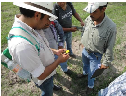
Figura 2. Georreferenciación de trampas para el monitoreo del PAC.

Dichas trampas se revisarán cada catorce días y se analizará la información en el Sistema de Monitoreo de Diaphorina (SIMDIA), lo anterior para la toma de decisiones de acuerdo al umbral de acción determinado por el Grupo Técnico del Estado.