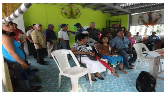
Figura 7. Taller a productores sobre síntomas de plagas reglamentadas de los cítricos y control de diaforina

d) Entrenamiento: Con el propósito de difundir la estrategia operativa de la Campaña, así como la sensibilización hacia los productores sobre la importancia de las enfermedades y adopción de las acciones mediante el establecimiento de AMEFIs, se realizaron 4 Talleres Participativos en los Municipios de Fco. Z. Mena y V. Carranza, correspondientes a la JLSV Sierra Norte; Teziutlán y Ayototxco de Guerrero, correspondientes a la JLSV Sierra Nororiental. Con esta acción se benefició un total de 60 productores.