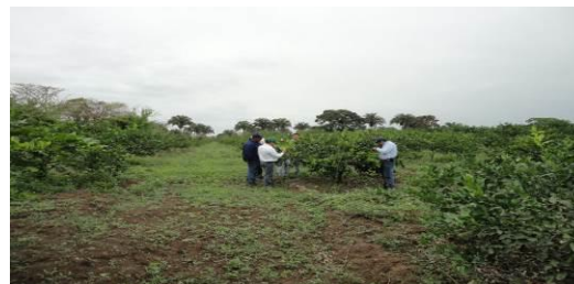
Figura 5. Toma de muestras de psílicos en huertas comerciales