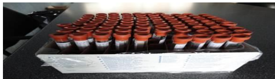
Figura 8. Muestras de psílicos preparadas para su envío a ENECUSAV

e) Diagnóstico. En materia de diagnóstico se colectaron 174 muestras las cuales se enviaron a ENECUSAV en Querétaro, para su análisis.