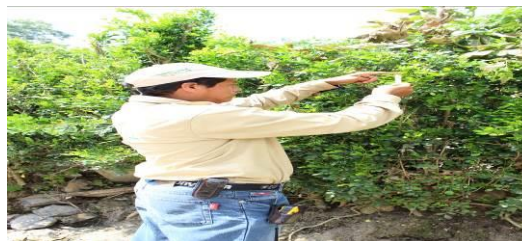
Figura 6. Toma de muestras de psílicos en Rutas urbanas

d) Entrenamiento: Con el propósito de difundir la estrategia operativa de la Campaña, así como la sensibilización hacia los productores sobre la importancia de las enfermedades y adopción de las acciones mediante el establecimiento de AMEFIs, se realizaron 4 Talleres Participativos en los Municipios de Fco. Z. Mena y V. Carranza, correspondientes a la JLSV Sierra Norte; Teziutlán y Ayototxco de Guerrero, correspondientes a la JLSV Sierra Nororiental. Con esta acción se benefició un total de 60 productores.