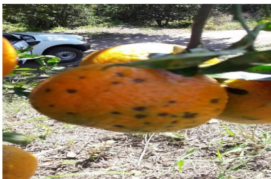
Figura 3. Exploración para detección de síntomas de Leprosis